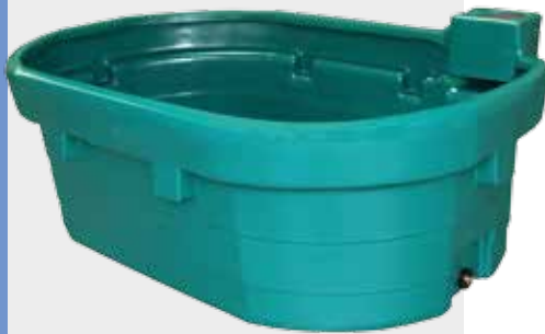
WT400, WT600, WT1000