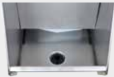
Ansicht Ablauf von innen