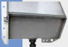
Ansicht Ablauf von außen