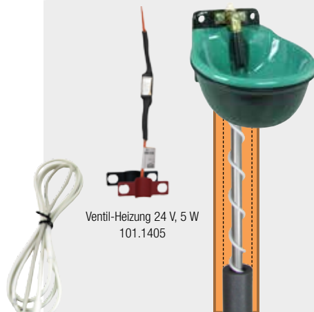
Ventil-Heizung 24 V, 5 W 101.1405