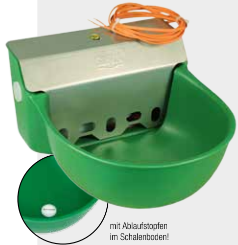
mit Ablaufstopfen im Schalenboden!