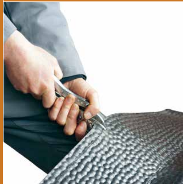
Le tapis moelleux est facilement transportable au moyen d'une pince.