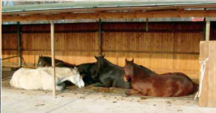
Détention en groupe dans une exploitation européenne.