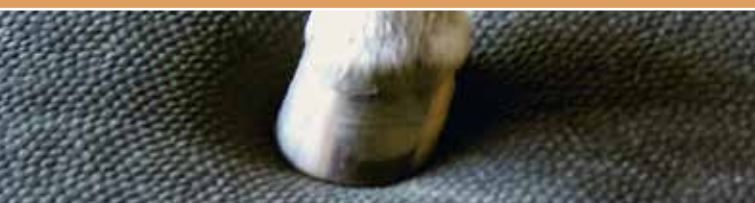
Le tapis moelleux – une surface de couchage souple et durable.