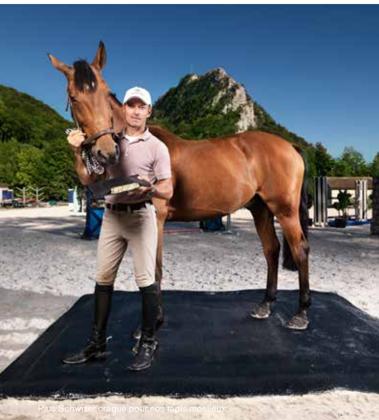
Plus Schwizer craque pour nos tapis moelleux.