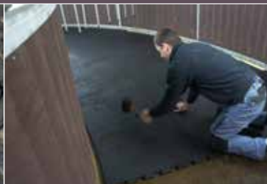
Puzzelsystem für einfache Montage