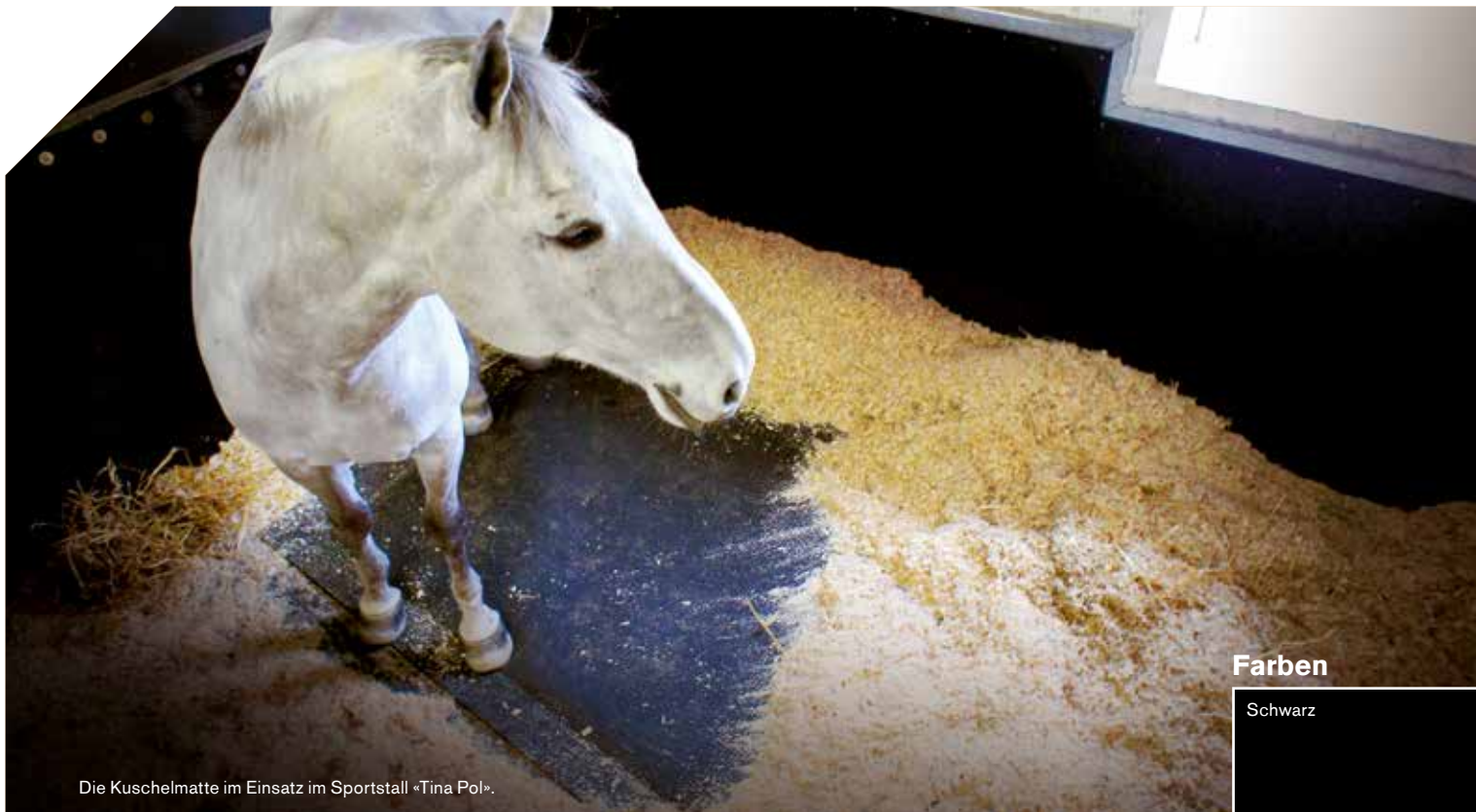
Die Kuschematte im Einsatz im Sportstall «Tina Pol».