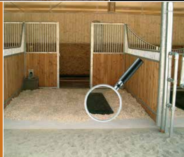
Die Kuschematte muss vollständig mit Einstreu bedeckt werden.

Kuschematten eignen sich nicht nur für die Freizeitpferdehaltung , sondern bieten auch für Hochleistungssportpferde überzeugende Vorteile. Die Kuschematte besitzt eine rutschhemmende Oberfläche sowie innerhalb der Gummiummantelung einen extra weichen Schaumstoffkern. Aufgrund dieser speziellen Beschaffenheit hat das Pferd einen äusserst rutschfesten Untergrund, der gleichzeitig eine sehr gelenkschonende Wirkung hat. Die Verletzungsgefahr wird dadurch stark reduziert und die Muskelregeneration gefördert. Durch die hervorragende Isolation ist das Pferd zudem ausgezeichnet vor Kälte geschützt. Viele Reitsportler setzen deshalb auf unsere Kuschematte . Zu unseren Referenzen zählt unter vielen Topreitern auch Pius Schwizer . In den internationalen Deckstationen erfreut sich die Kuschematte ebenfalls grosser Beliebtheit. So wird sie beispielsweise vom Gestüt Sprehe schon seit Jahren erfolgreich eingesetzt. Dank des geringeren Zeitaufwands beim Ausmisten bleibt mehr Zeit für Sie und Ihr Pferd.