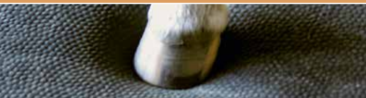
Die Kuschelmatte – Eine dauerhafte, weiche Liegefläche.