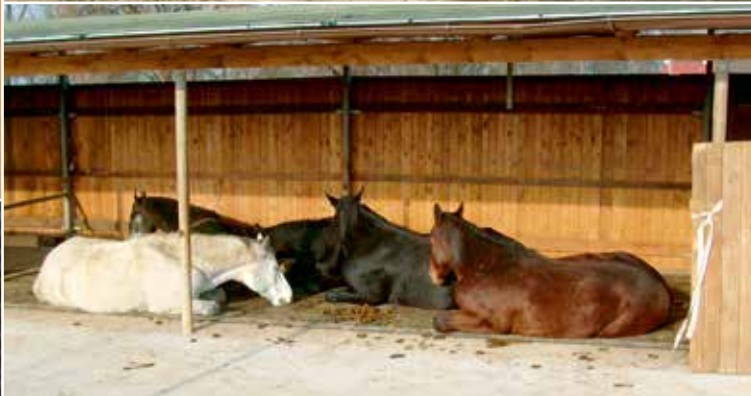
Gruppenhaltung in einem EU-Betrieb.