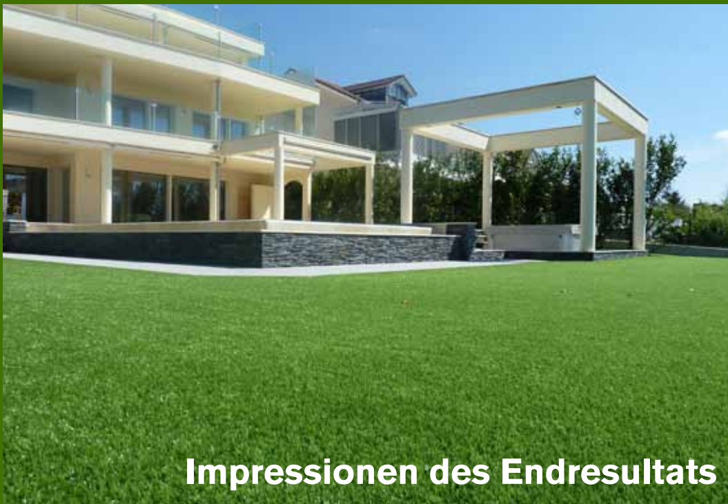
Impressionen des Endresultats